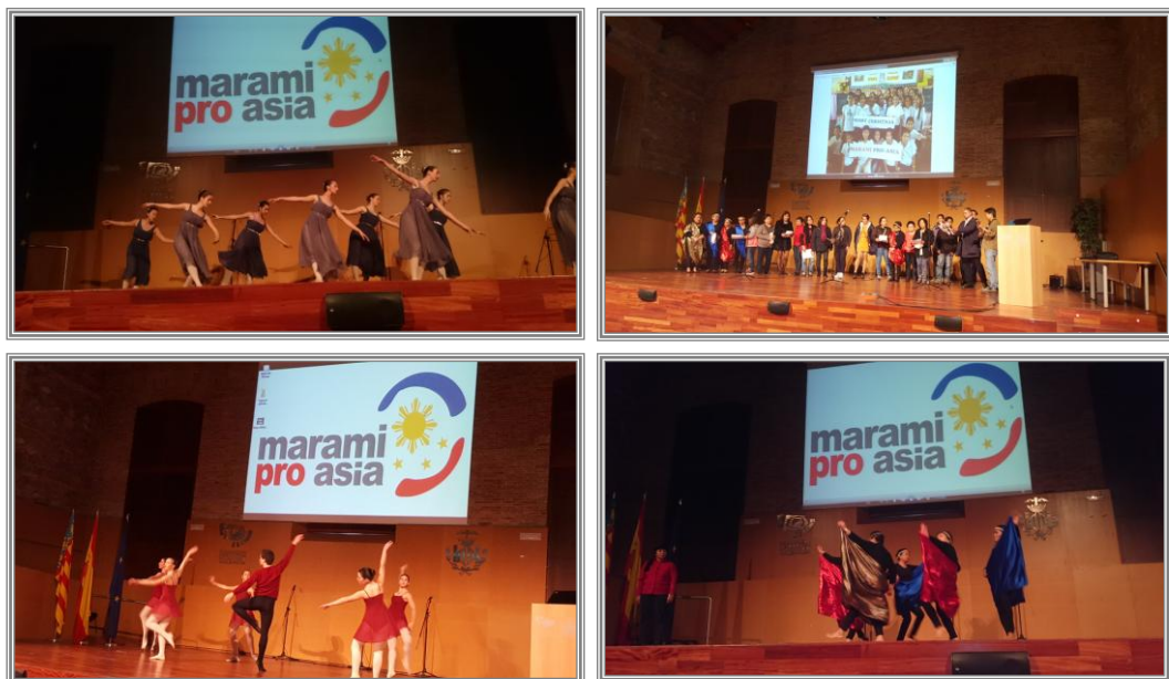
Presentación de los Proyectos de 2015

En la presentación de los proyectos de 2014 y 2015, las mujeres filipinas prepararon bailes típicos. La Escuela de Danza de Torrente María Isabel y María Dolores ofreció dos números de ballet. La comunidad filipina en Valencia animaron el evento cantando unos villancicos en tagalog. Tras finalizar la presentación, hubo una degustación de platos típicos filipinos preparados por la comunidad filipina en Valencia.