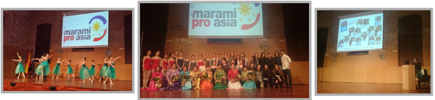
Presentación de los Proyectos de 2014

Cada año, Marami pro Asia hace una presentación de los proyectos de Cooperación Internacional para repasar todas las actividades realizadas en Filipinas. Estas presentaciones tuvieron lugar en el Centro Cultural La Pechina. Asistieron voluntarios, amigos, familias y colaboradores en los proyectos. El 15 de febrero tuvo lugar la presentación de los Proyectos de 2014 y el 27 de diciembre el de los Proyectos de 2015.